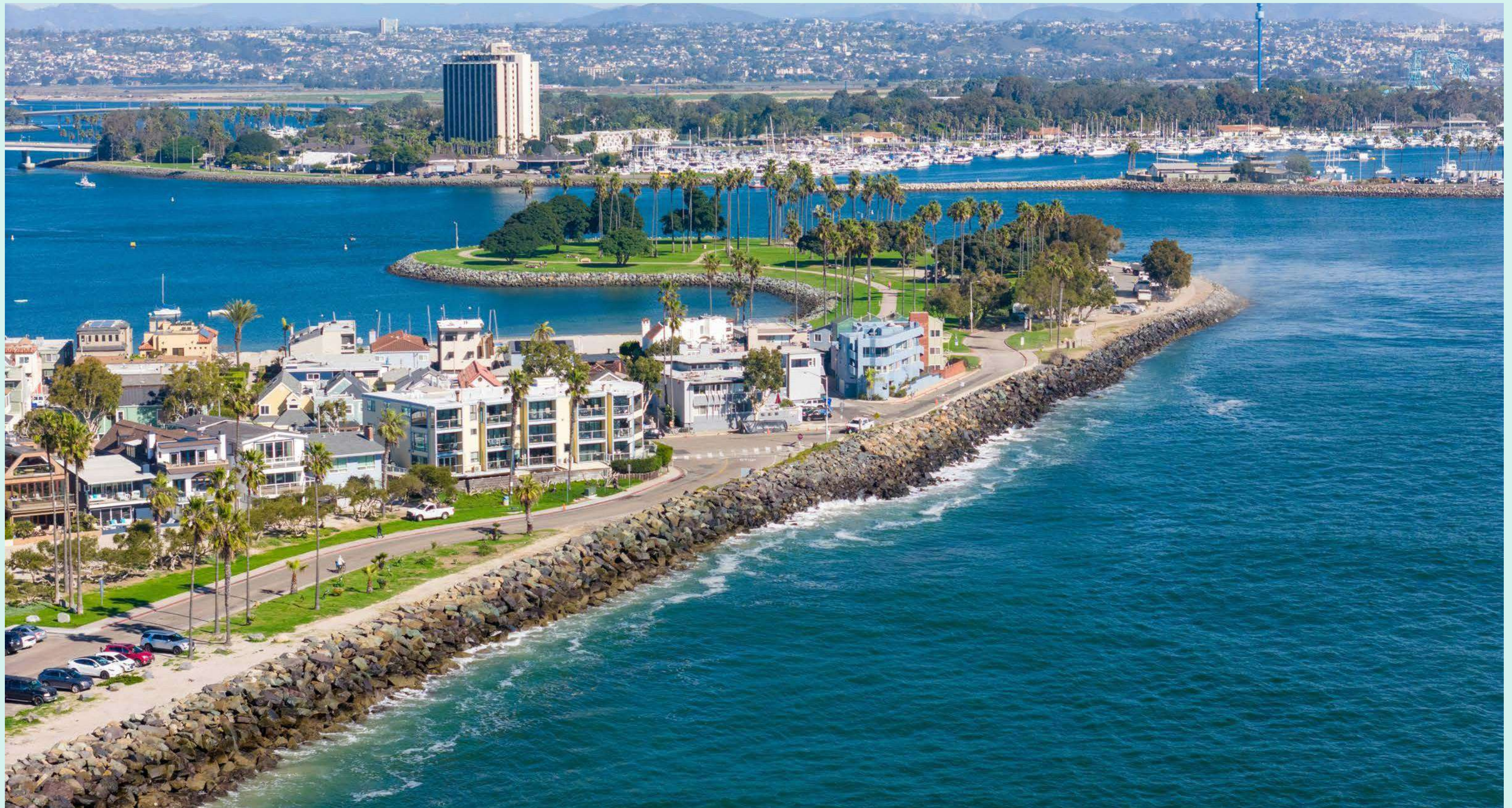
San Diego, California